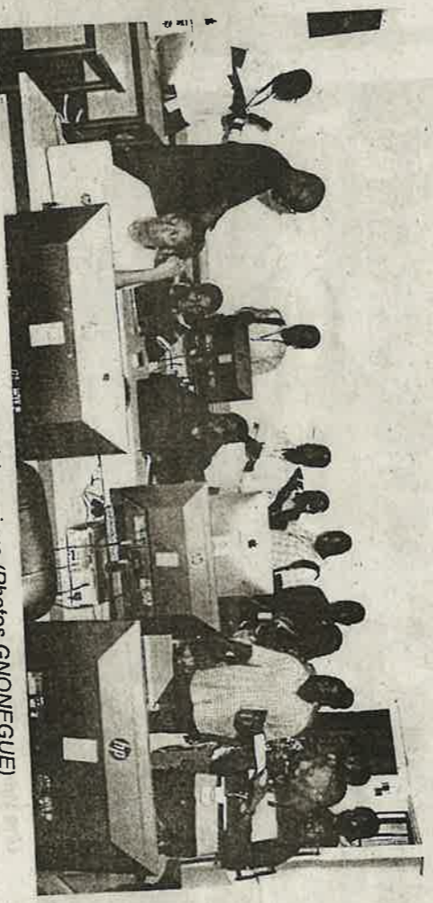
Visite guidée dans un centre pédagogique.

L'Université de Lomé a fait des progrès. Classée 5 e en 2020, elle a gagné trois places, ces dernières années, pour se propulser en deuxième position dans l'espace francophone, selon le classement UniRank 2024 des universités africaines. Cette place qui n'est pas, en effet, le fruit du hasard, est plutôt le prix de ses performances reflétant le succès des réformes révolutionnaires mises en place, ces dernières années. Poursuivant la recherche de la qualité et engagée dans une dynamique d'amélioration de la perception de son image, elle a initié, mardi, une visite guidée de ses installations à l'intention des médias, avec l'idée d'améliorer