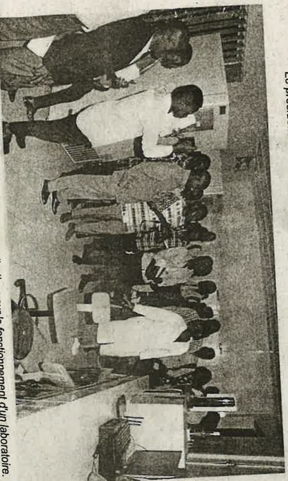
Les professionnels des médias reçoivent des explications sur le fonctionnement d'un laboratoire.