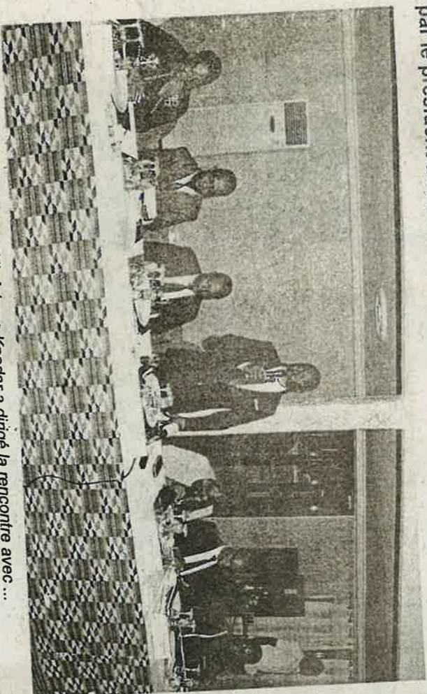
Le président de l'UL Adama Kpodar a dirigé la rencontre avec ...

La Direction de la communication et du protocole de l'Université de Lomé a organisé, mardi, « un voyage de presse » sur le campus universitaire. Cette activité, qui a consisté en une visite guidée des installations universitaires et la découverte de nouveaux projets en cours de réalisation, visait à mettre à la disposition des hommes de médias les informations utiles, dans le but d'améliorer la visibilité de ce temple du savoir et renforcer ainsi son réseau de partenariat. C'est alors que différents compartiments ont été visités, donnant l'occasion aux animateurs de l'espace médiatique de mieux cerner le fonctionnement de l'institution. Le déjeuner de presse, qui a sanctionné la visite guidée, a été dirigé par le président de l'Université, Pr Adama Mawulé Kpodar, en présence du staff de l'UL et des responsables des services centraux.