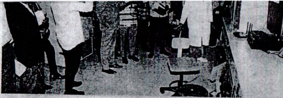
Les professionnels des médias reçoivent des explications sur le fonctionnement d'un laboratoire.