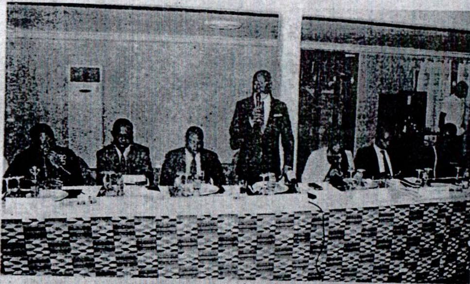
Le président de l'UL Adama Kpodar a dirigé la rencontre avec ...

La Direction de la communication et du protocole de l'Université de Lomé a organisé, mardi, « un voyage de presse » sur le campus universitaire. Cette activité, qui a consisté en une visite guidée des installations universitaires et la découverte de nouveaux projets en cours de réalisation, visait à mettre à la disposition des hommes de médias les informations utiles, dans le but d'améliorer la visibilité de ce temple du savoir et renforcer ainsi son réseau de partenariat. C'est alors que différents compartiments ont été visités, donnant l'occasion aux animateurs de l'espace médiatique de mieux cerner le fonctionnement de l'institution. Le déjeuner de presse, qui a sanctionné la visite guidée, a été dirigé par le président de l'Université, Pr Adama Mawulé Kpodar, en présence du staff de l'UL et des responsables des services centraux.