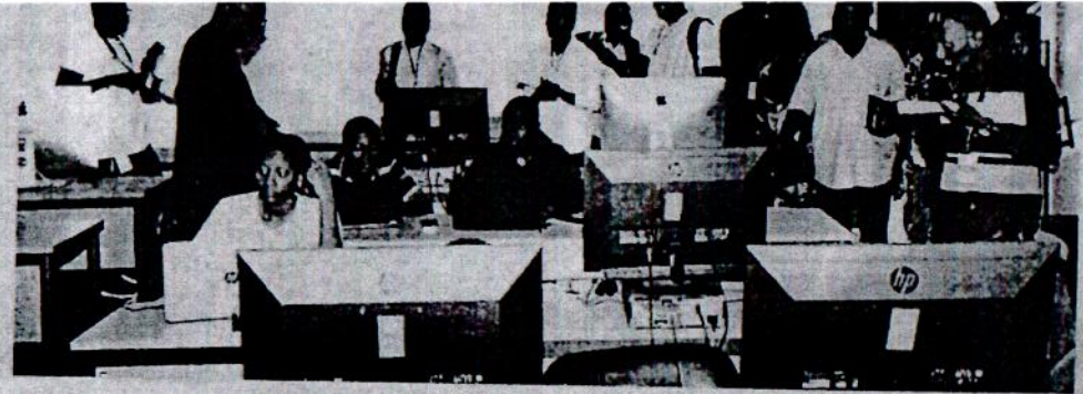
Visite guidée dans un centre pédagogique.

L'Université de Lomé a fait des progrès. Classée 5 e en 2020, elle a gagné trois places, ces dernières années, pour se propulser en deuxième position dans l'espace francophone, selon le classement UniRank 2024 des universités africaines. Cette place qui n'est pas, en effet, le fruit du hasard, est plutôt le prix de ses performances reflétant le succès des réformes révolutionnaires mises en place, ces dernières années. Poursuivant la recherche de la qualité et engagée dans une dynamique d'amélioration de la perception de son image, elle a initié, mardi, une visite guidée de ses installations à l'intention des professionnels des médias, avec l'idée d'améliorer