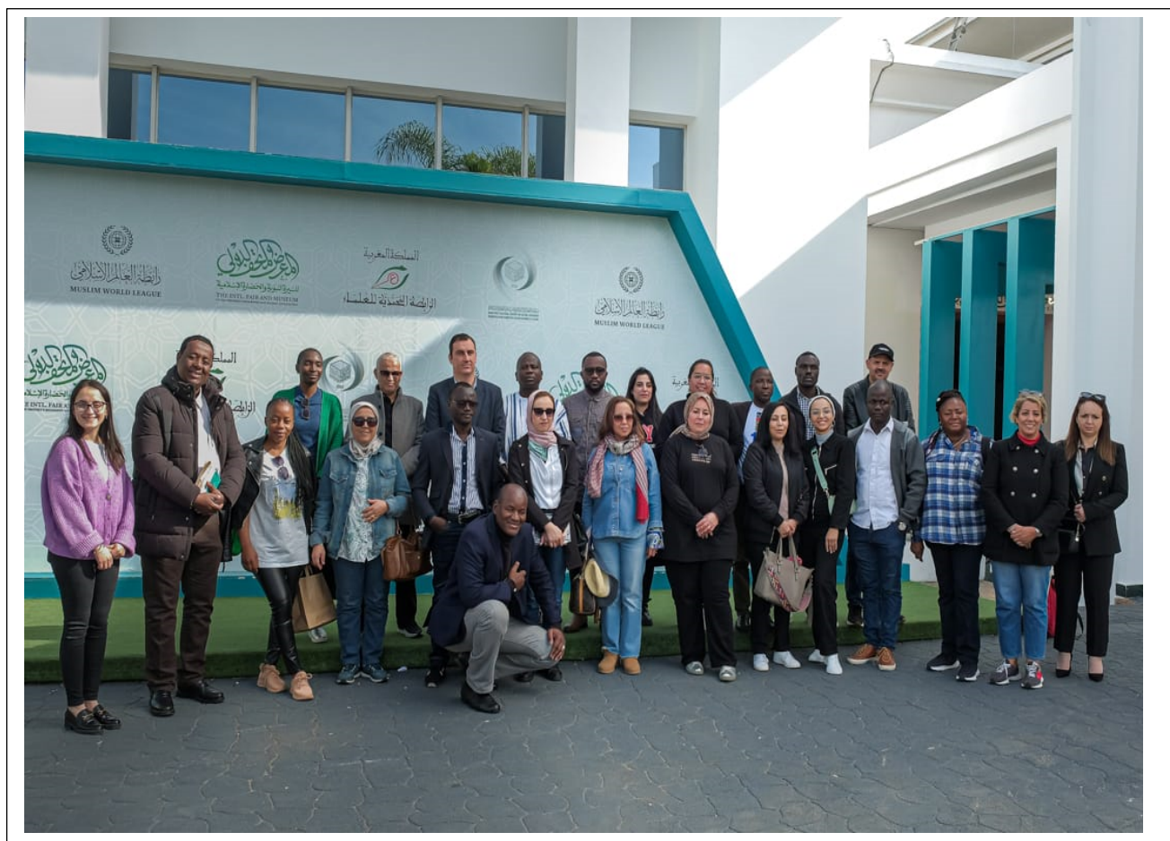
Photo 3. Photo de groupe au Musée de la Sirah

Au Musée de la Sirah (Photo 3), les participants ont eu droit à une visite guidée et à un projection de film sur la vie du prophète de l'islam