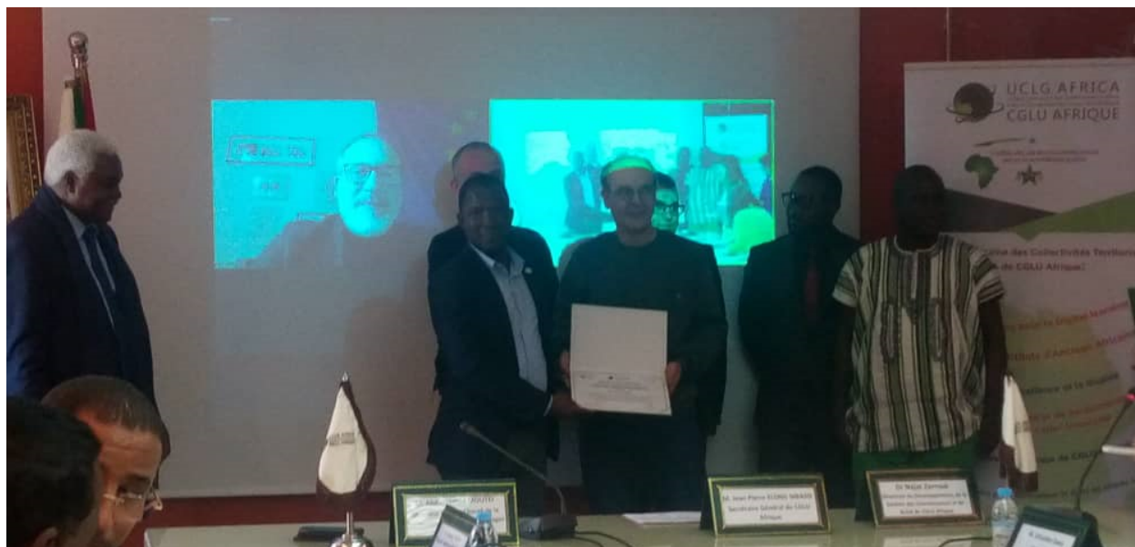
Photo 4. Remise de l'attestation de formation